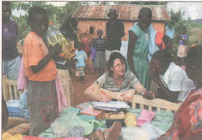
Diesen Kindern in Uganda soll geholfen werden: Eine Mitarbeiterin von „Bulungi“ verteilt etwas an die Kinder vor Ort.

Pfarrverband Kreiensen und Kooperationspartner sammeln für „Bulungi“